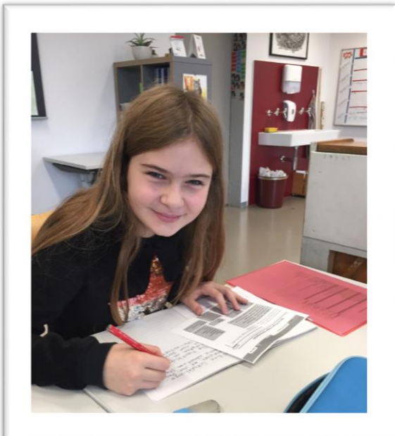
Es wird geschrieben

Wir selbst sind gespannt, wie unsere Schule wahrgenommen wird und welche Stärken und Schwächen bestehen.